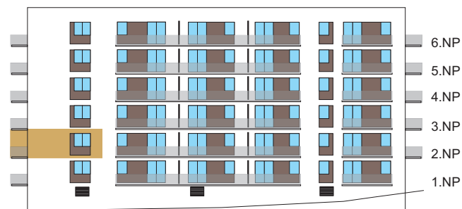
Západní pohled na dům/ Building View - West side